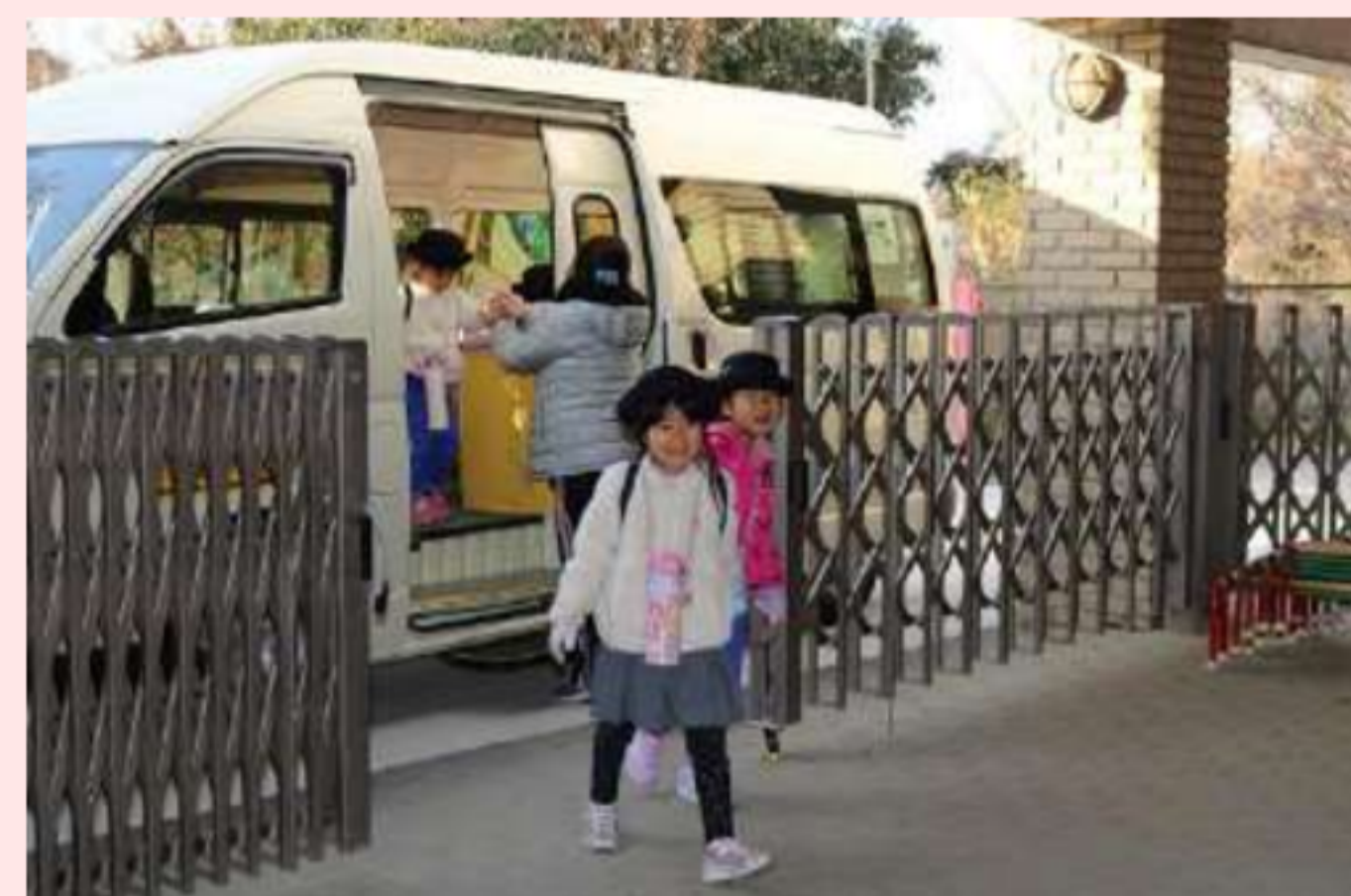
バスでの送迎も行っています