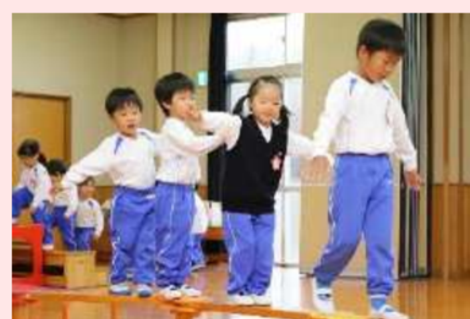
制作・絵画・裏山遊び リトミック・畑のお世話 体操・英語遊び など