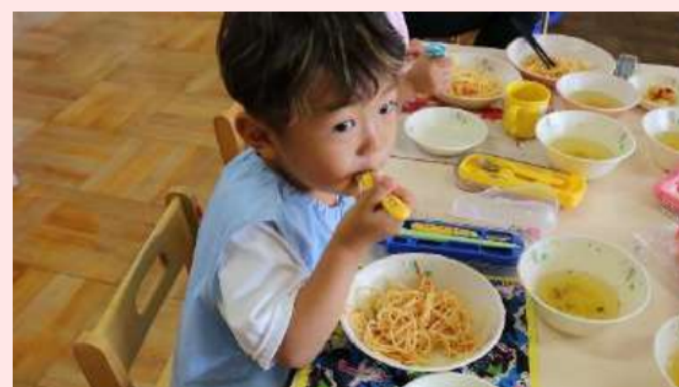
月曜日～土曜日 自園給食