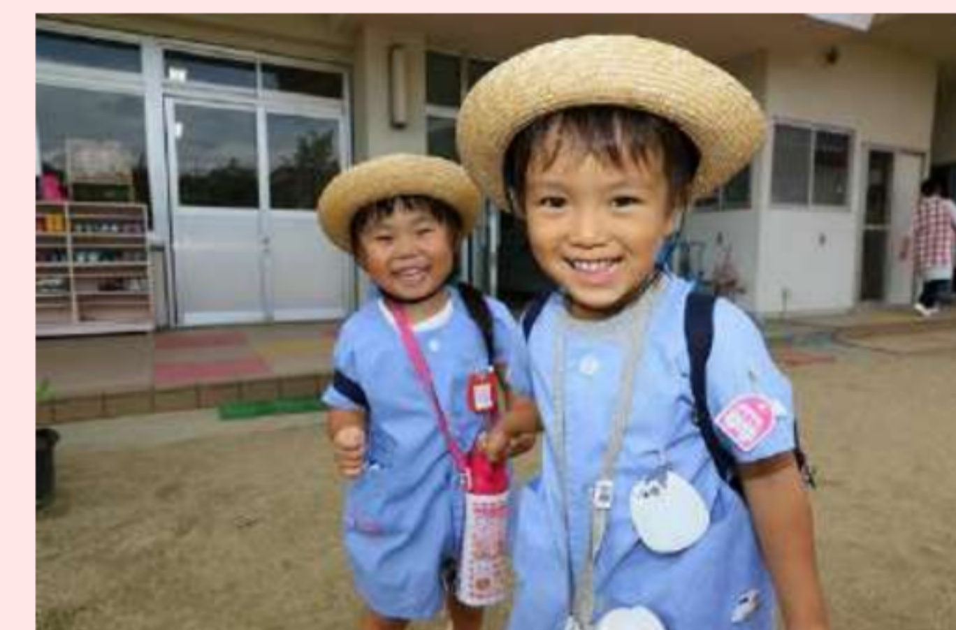
降園準備・順次降園（バス降園・お迎え）